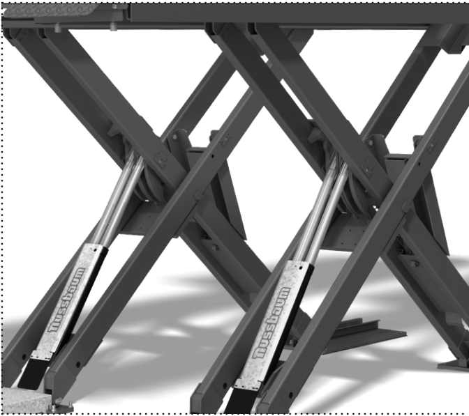
Hubhöhe bis 2185 mm dank neuer, verlängerter Scheren Lifting height up to 2185 mm thanks to the new extended scissors