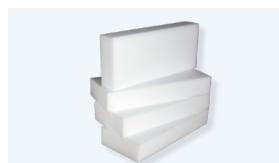
Incluye 4 tacos de apoyo de polímero (50 x 150 x 340 mm)