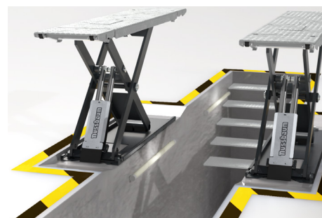
Se puede instalar sobre un foso o a nivel del suelo para garantizar una comodidad óptima durante el trabajo