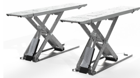
Elevador galvanizado en caliente para obtener una mayor protección