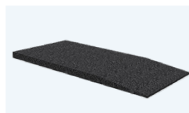
Rampas tuning para vehículos con muy poca altura / kit, 4 unidades